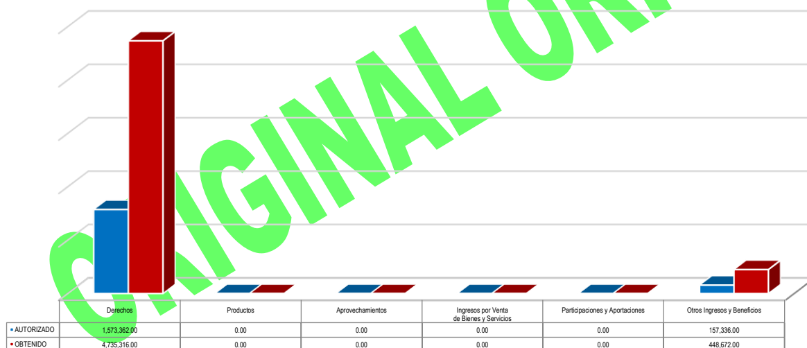
Gráfico 1. Ingresos

Nota: En la cuenta de Otros Ingresos y Beneficios se incluye la cuenta de impuestos.